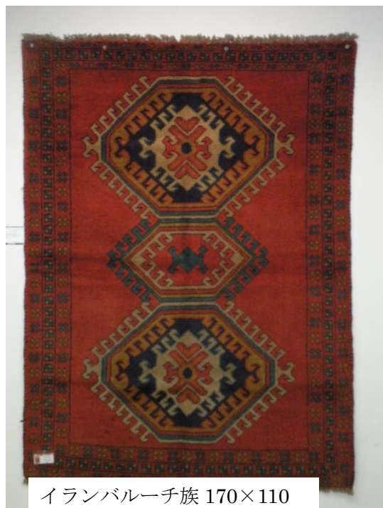
イランバルーチ族 170×110